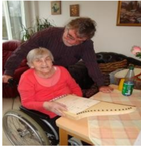
Bewohnerin spielt auf der Veeh-Harfe

Wir – das TEAM der Beschäftigung und Betreuung – stellen uns vor: